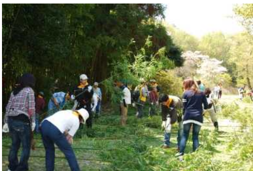
↓伐採した竹の枝払い