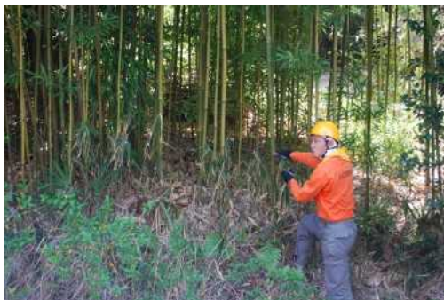
↓竹伐採方法の説明