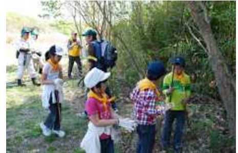
↓竹の説明後、子ども達が竹に触れる