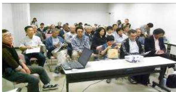
会場には当日参加の方も多く予定を大きく上回り、立ったままのスタッフも出る盛況さ、熱気あふれる会場となりました

そのため今回全会員に呼びかけ、新しい班と併せ既存の班の説明会を行うとともに出来るだけ多くの会員に班活動に参加していただくよう呼び掛けることにした次第です。