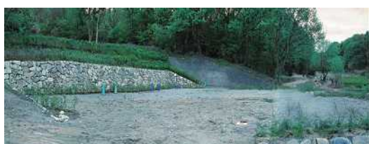
炭焼き広場は材料の置場もたっぷり、炭焼き窯の完成が待たれます

既に活動している各班の紹介を班の代表者が行い新規会員を歓迎する旨呼びかけた後、今回新しく立ち上げる3つの班の説明と参加希望の申し込み受け付け、最後に希望者で炭焼き、田んぼ、畑の予定地を訪れそれぞれの活動フィールドに思いをはせました。