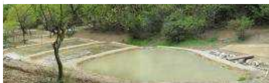
田んぼは既に満々と水をたたえ田植えを待っています