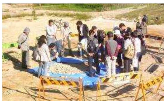
説明会の後現場見学へ。夕日の中、炭焼き広場では今日から始まったか窯の基礎工事につき炭焼き名人から説明を受ける参加者の皆さんです