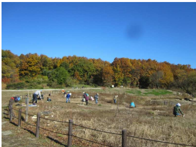
大坂池周辺の草刈り

○外来種の駆除は、午前中に終わり、午後は子どもたち中心の落ち葉掻きと午前に引き続いての大坂池周辺の草刈りでした。草刈りでは、昨日の雨でアレチケツメイやセイダカアワダチソウなどほとんどの草は抜き取りが容易であったがイネ科の大きな草の株は掘り起こしに苦勞をしたため全部を刈り取ることが出来ませんでした。里広場からの景観はずっと良くなりました。