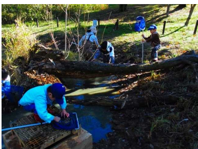
奥池のヒメダカなど駆除