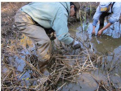
トンボ池のオオフサモ駆除