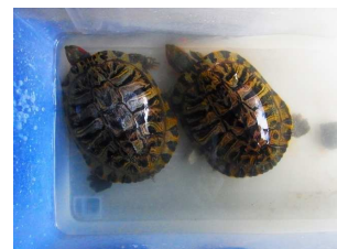
大坂池で捕獲した ミシシippアカミミガメ