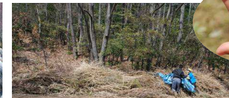
2トン車6台分の刈り草