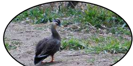
カルガモ右往左往