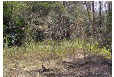
今回の主作業の場所