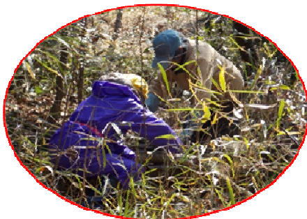
湿地周辺でササ刈に精を出す女性群