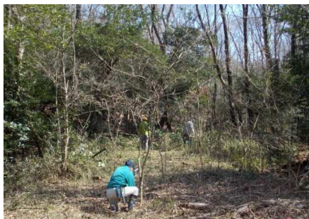
ササ刈も終わりに近づいて