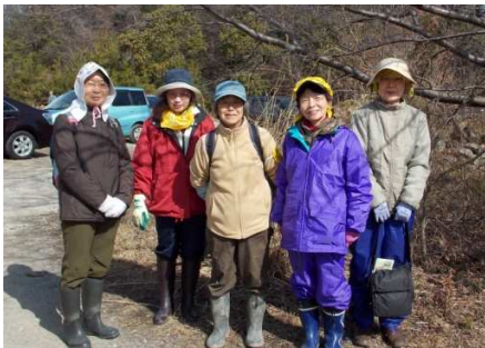
ひな壇の五人囃子かな？

○作業場所は草もなく広々となりコバノミツバツツジの群生地、ギフチョウの繁殖地になれば良いと期待して散会した。