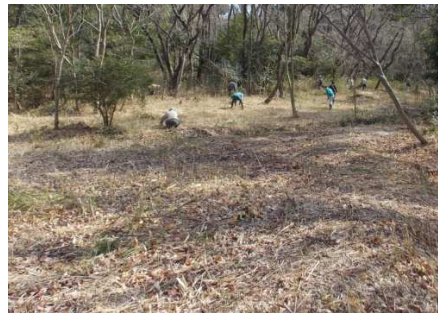
手前の広場は1月に手入れした場所