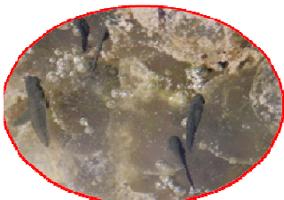
アカガエルのオタマジャクシ