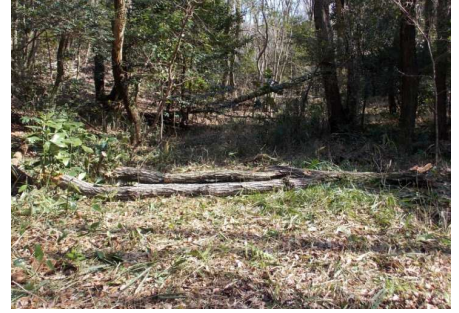
バイク、自転車が通行しづらくした