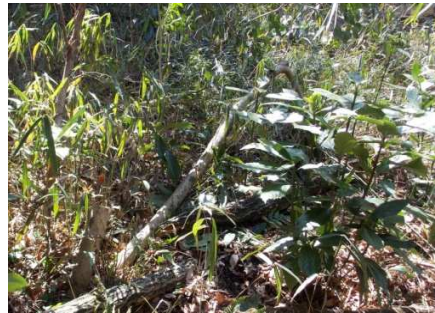
一番奥に生えたカクレミノを伐採しヒメカンアオイを保護