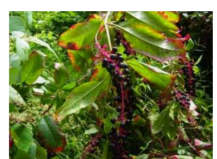
ヨウシュヤマゴボウの実