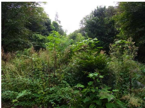
(上) こんなに雑草の生い茂った森が (中) みんなの努力で (右) こんなにサッパリしました