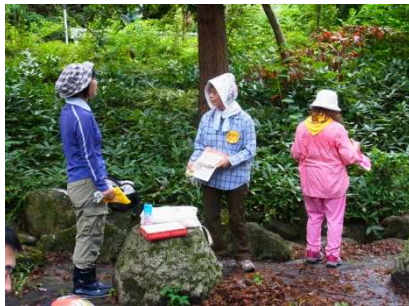
左…受付も女性会員の助け合いで