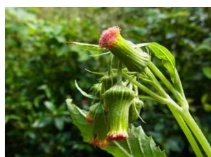
ベニバナボロギク