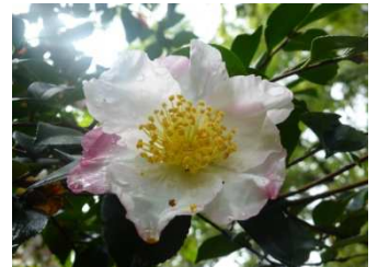
アザミやサザンカも見守っています