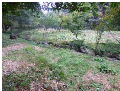
(上下) 今日の成果です!