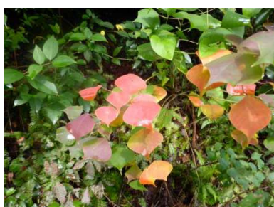
木の葉も秋の装いです