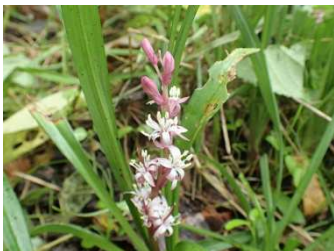
キチジョウソウやボロギク

○午前中、集中的に作業がはかどり午後は参加者もほぼ半分となりましたが、ポツリポツリと来たこともあり予定を早め14時に作業を終了、道具の手入れをして現地解散となりました。連休の最中、本当にお疲れ様でした。