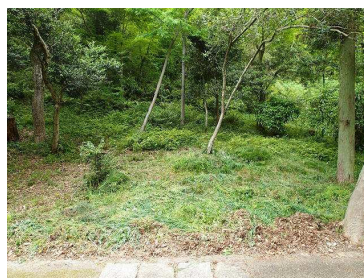
作業後の散策路沿い