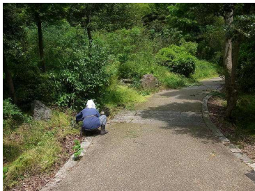
散策路沿いの草刈

○一粒荘跡地についてはここ数年の定例活動のお陰で、暗かった竹林は明るくなり、林床には種々の草花が咲き、東山公園の代表的な景観の一つとなりつつあります。今後とも、作業を継続することで、こうした豊かな景観が後世に残せればと願っています。14時半に活動を終了し、解散となりました。