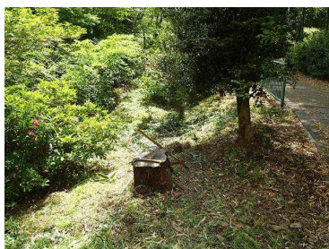
作業後の集合場所付近