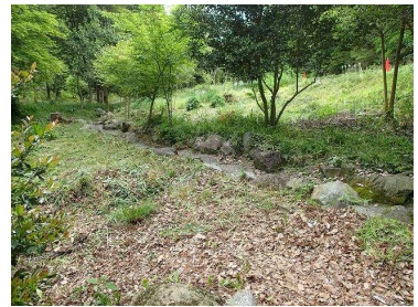
作業後のセセラギ付近